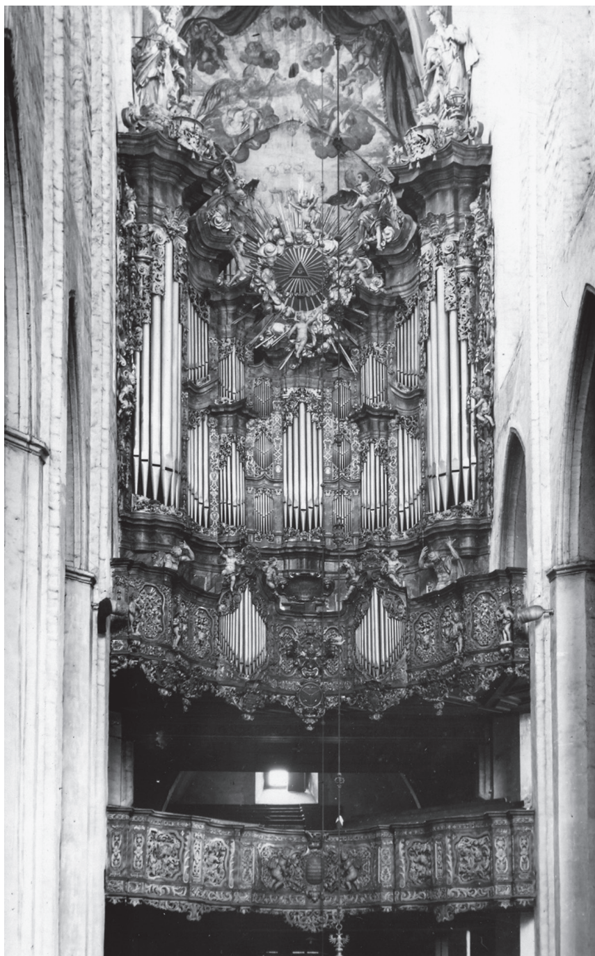
Il. 1. Prospekt organowy Michaela Englera, 1725–1730 r., stan ok. 1930 r.