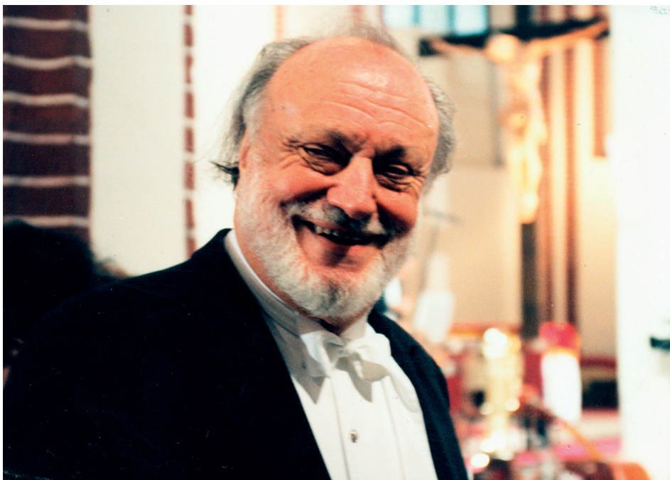
Il. 6. Kurt Masur, 1994 r.

Taką samą funkcję pełnił w latach 1960–1964 w Komische Oper w Berlinie i Dresdner Philharmonie w Dreźnie (do 1972). W latach od 1970 do 1996 pełnił funkcję dyrektora muzycznego najbardziej znanej orkiestry dawnych Niemiec Wschodnich Gewandhausorchester Philharmonie Leipzig. Razem z tą orkiestrą wykonał ponad 900 koncertów niemal na całym świecie 26 . To umożliwiło mu kontynuowanie kariery na stanowisku dyrektora muzycznego uznanej orkiestry nowojorskich filharmoników, którą to funkcję sprawował od 1991 do 2002 r. Potem kierował jeszcze orkiestrą filharmonii w Londynie (od 2002 r.) i Orchestre National de France w Paryżu (od 2002 r.). Dyrygował wieloma znakomitymi zespołami, także po zakończeniu swojej oficjalnej kariery, będąc świadomym ograniczenia swoich możliwości w związku z dokuczającą mu chorobą.